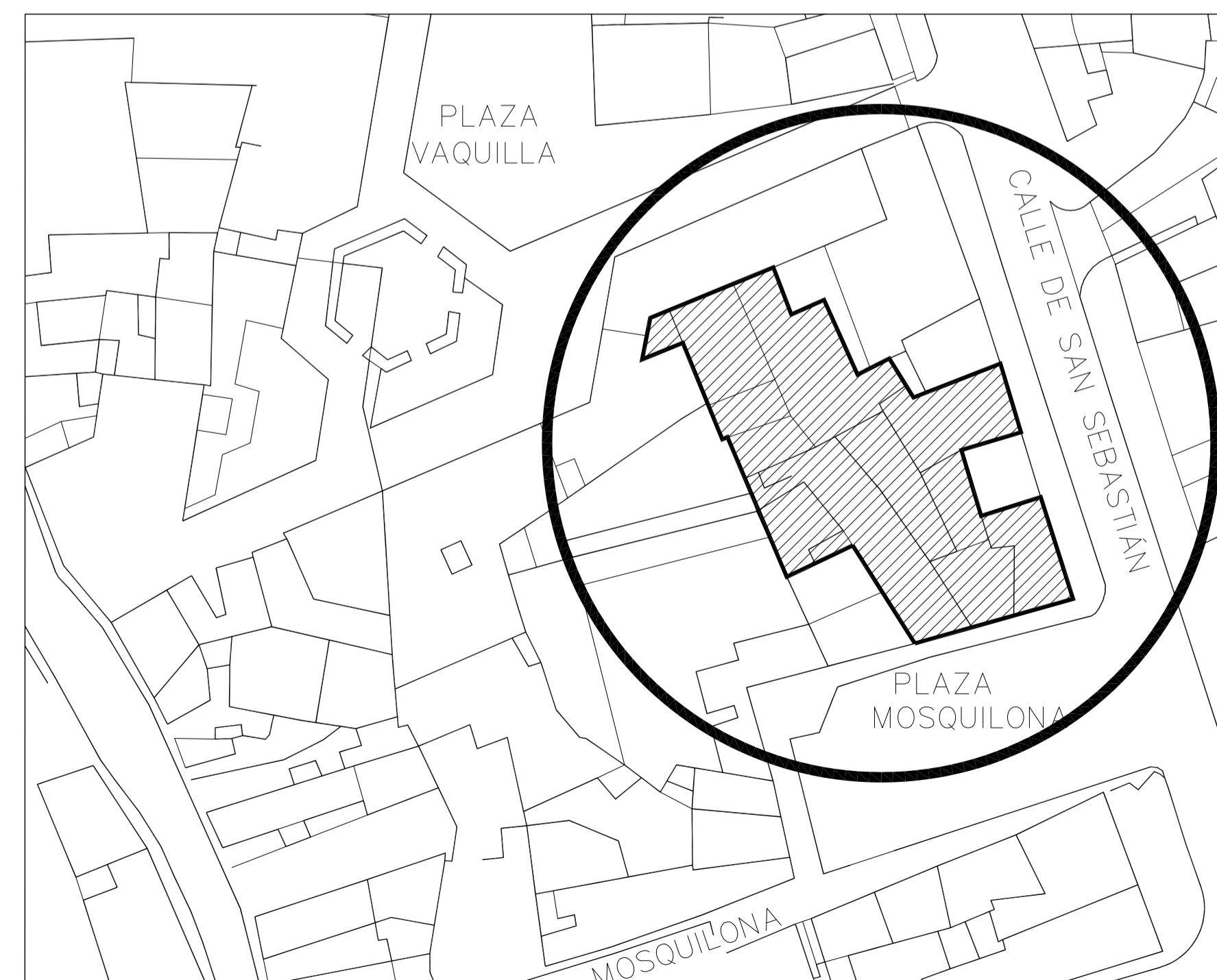
SITUACIÓN Escala 1/1000

SUP. CONSTRUIDA TOTAL 1.015,16 m 2 SUP. COMPUTABLE TOTAL 995,72 m 2